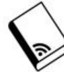
buch und netz